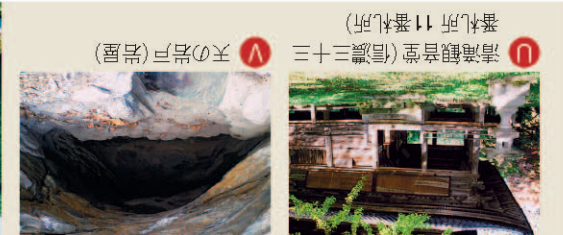
松代町小島田から見た山並み(奇妙山の裾に農業大学が見える)

自然の四季折々に、魅力ある山のトレッキングを、それぞれのコースで大いに満喫しよう! また史跡・文化財など多くの名所・旧蹟も訪ねてみよう。