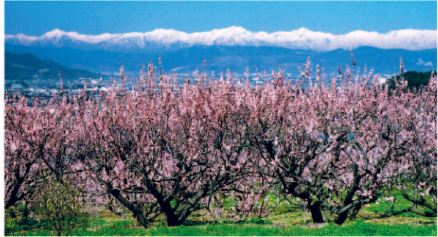
東条あんず(杏)の里から遠く北アルプスを望む