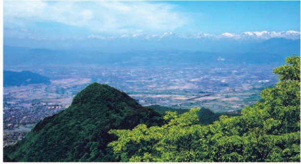
奇妙山中腹、高見岩上から見た長野市街と北アルプス(手前はニヶ山)

山城跡や古墳群、石幢や多くの石の文化財等も。静かな山裾には、ゆったりとあんず(杏)の里や肥沃な田園が広がっています。