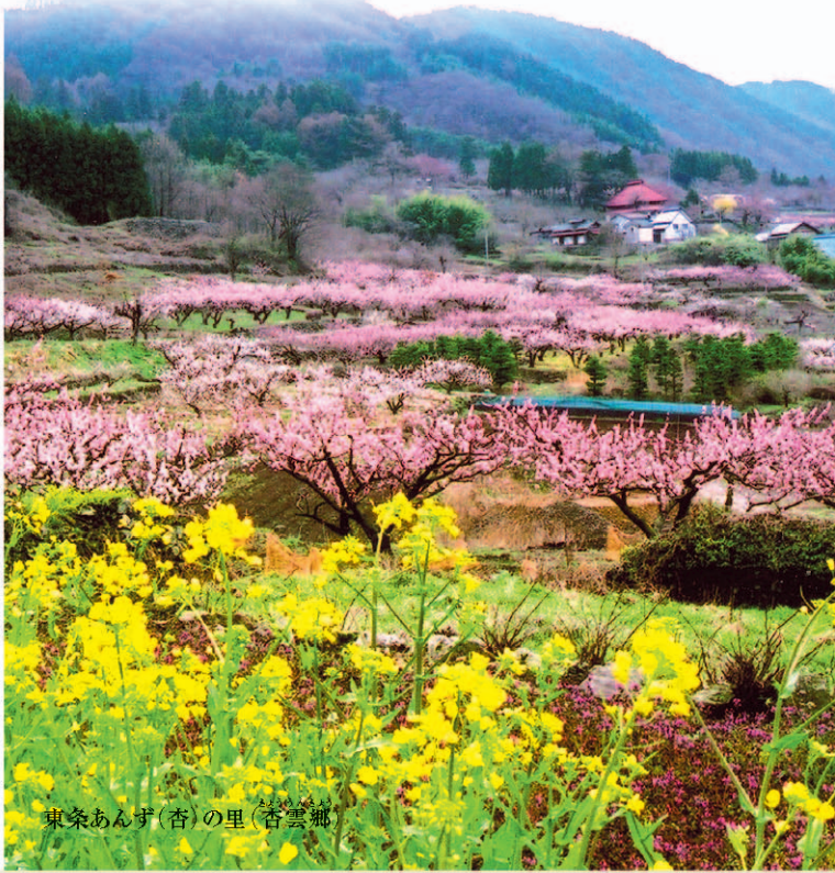
東条あんず(杏)の里(杏雲郷)

北アルプスなど遠く近くの山並み、悠久の流れ千曲川・犀川、広く川中島平を眺望するニヶ山・奇妙山は、すぐそこで私たちを呼んでいます。 ※コースには足下の険しい箇所もありますので、ご注意ください。