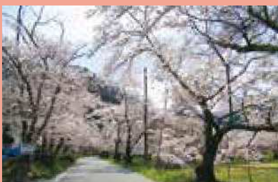
桜の名所としても人気です。

〈泉質〉カルシウム・ナトリウム-塩化物・ 硫酸塩温泉 〈効能〉慢性皮膚病、やけど、きりきず