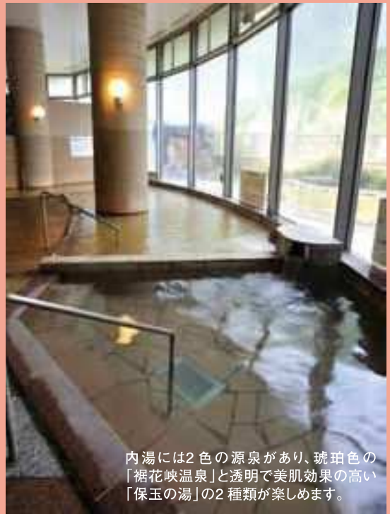
内湯には2色の源泉があり、琥珀色の「裾花峡温泉」と透明で美肌効果の高い「保玉の湯」の2種類が楽しめます。