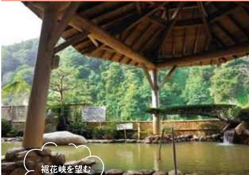
裾花峡を望む 天然温泉