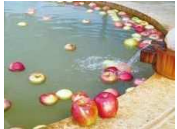
図 10:00~22:00(最終入館受付21:30) お食事処/平日11:00~14:00、16:00~20:00(L.O.19:30) 土日祝11:00~20:00(L.O.19:30) 休 第4火曜(祝日の場合は翌日) 料 10:00~18:00/大人(中学生以上)410円、小学生300円 18:00~22:00/大人(中学生以上)350円、小学生250円、幼児無料 因 長野市豊野町石417 図 026-257-6161

りんごの名産地豊野町にある温泉施設「りんごの湯」。リーズナブルな料金と美人の湯として知られる名湯は市民が日常的に訪れる温泉です。毎月5日、15日、25日はりんごが浮かぶ「りんご風呂」をお楽しみいただけます。