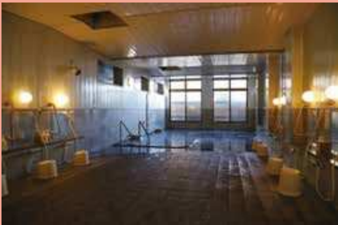
高台にある かけ流し温泉

「保玉の湯」 〈泉質〉含硫黄・ナトリウム-炭酸水素塩冷鉱泉 〈効能〉慢性皮膚病・慢性婦人病・糖尿病・きりきず など