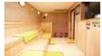
サウナ・露天風呂もあります!

〈泉質〉 ナトリウム・カルシウム-塩化物温泉 〈効能〉 疲労回復、健康増進、神経痛、 筋肉痛、関節痛、関節のこわばり、 うちみ、くじき、切り傷、やけど、慢性皮膚病、 消化器病、婦人病、冷え性など