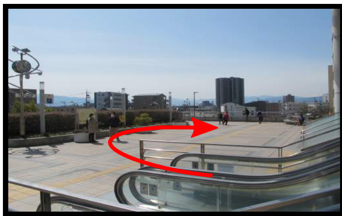
④右奥の方向へお進みください。エスカレーターがございます。