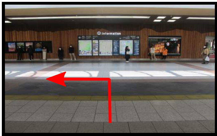
①新幹線改札口を出られたら、左手にお進みください。