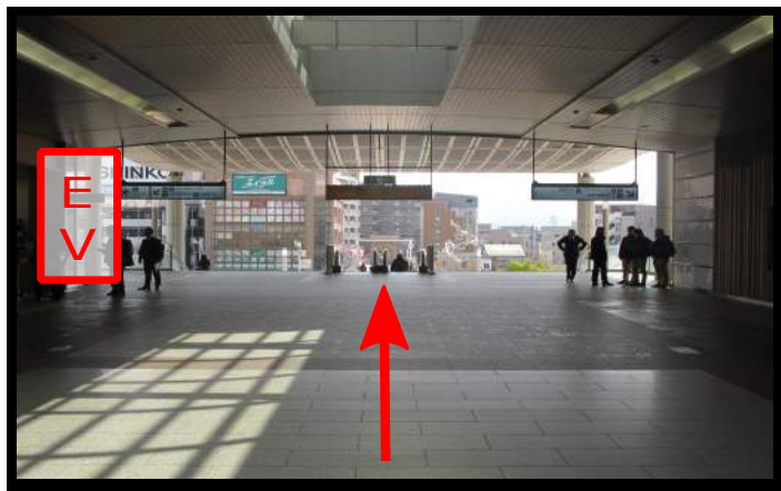
②まっすぐ進み、エスカレーターまたは階段で下の階へ下りてください。 ※エレベーター(EV)をご利用の方は、1階(地上階)で降りてください。