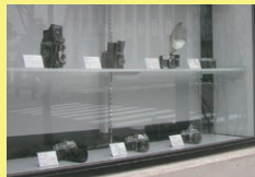
カメラ博物館 「表参道もんぜん駐車場」