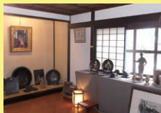
農民美術博物館 「門前茶寮彌生座」