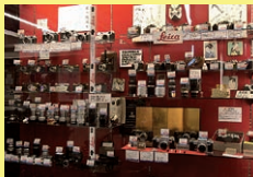
カメラ博物館 「山本写真機店」