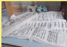
和紙博物館 「柏与紙店」