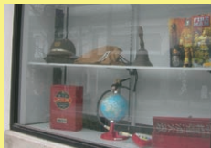
消防博物館 「表参道もんぜん駐車場」