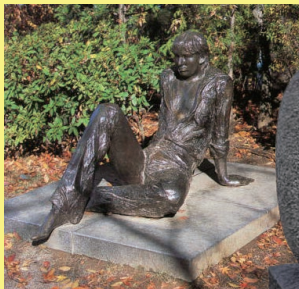
「憩う」城山公園 (ふれあい広場東)