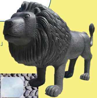
「ANIMAL2008」 城山公園 (ふれあい広場東)

街中にアート作品が展示されていたり、 隠れ家的ギャラリーが点在していたり… と探求心をくすぐるアートスポットがいっぱい! 市内散策のついでに探してみよう。