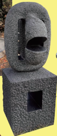
「オルメカの微笑」 城山公園 (噴水広場西入口)