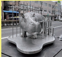
「工事現場」 長野大通り(南千歳)

長野市内には日本を代表する 現代彫刻家の作品がたくさん 展示されています。 その数なんと149点! 自分 のお気に入り作品を探すのもお すすめです。