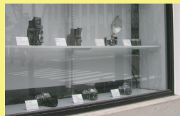
カメラ博物館 「表参道もんぜん駐車場」