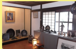
農民美術博物館 「門前茶寮彌生座」