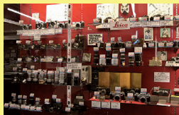
カメラ 寫真器博物館 「山本写真機店」