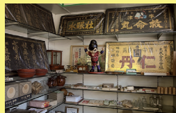
くすり博物館 「小林薬局」