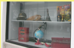
消防博物館 「表参道もんぜん駐車場」