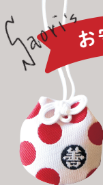
ぶくぶくまもり 福福守 600円

善光寺境内にある仏足跡の御守。本物そっくりな形がインパクト大!この御守を拝み、足腰健全を祈ります。