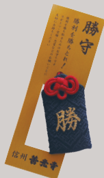
かちまもり 勝守 700円

いつでも身に付けられるブレスレット形の御守。家族・友人など、さまざまな良縁を祈念します。カラーも豊富!