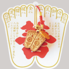
ぶっそくまもり 仏足守 700円

善光寺境内にある仏足跡の御守。本物そっくりな形がインパクト大!この御守を拝み、足腰健全を祈ります。