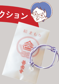
ゆい 結まもり 600円

「牛に引かれて善光寺」をイメージさせる可愛らしさ。福がおとずれますようにと願いをこめます。