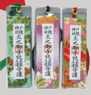
火之御子社 「芸能上達守」