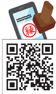
▲まち歩きスタンプラリーQRコード

スマートフォンを活用したデジタルモバイルスタンプラリー。市内の飲食店・土産店や観光地、期間中に開催されるイベントに参加し、スタンプをゲット。スタンプの点数に応じて、ノベルティや参加店舗で使える電子クーポン券がもらえます！ ※ノベルティや電子クーポン券は設定数に達し次第終了となります。